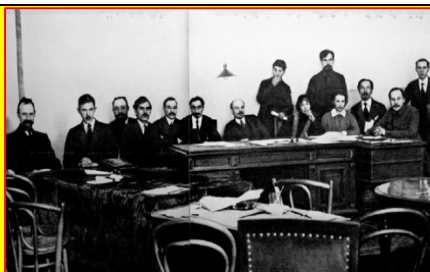
کولونتای در جمع اعضاء دولت نوزاد شوروی از جمله لنین (راست) کولونتای، کمیسر خلق، در جمع اطفال بی سرپرست (چپ)