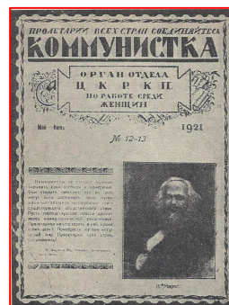
روی جلد یکی از شماره های نشریه شعبات زنان حزب

۳۰ در قطعنامه نهمین کنگره حزب کمونیست شوروی (بلشویک) گفته شده بود: "دولت شوروی یک اهرم انقلاب اقتصادی است، زیرا آن یک دیکتاتوری پرولتاریا است (...)" ( Resolutions and Decisions of the CPSU, vol.2(1917 - 1929), p.100 (Toronto, 1974). ۳۱ دبیرخانه بین المللی زنان در کمینترن به صورت شعبه ای از کمینترن در سال ۱۹۱۹ تشکیل یافته بود. کولونتای تا ۱۹۲۲ قائم مقام آن بود.