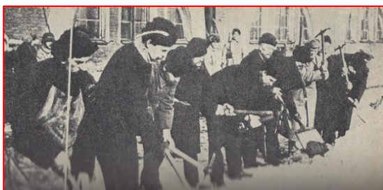
گروهی از بورژواها سرگرم انجام "وظیفه کار عمومی" (۱۹۱۸)

معه، هم چنین رُلی ایفاء نموده که بسیار بزرگ تر از فقط پذیرفته شدن رسمی برابری سیاسی و اجتماعی زنان می باشد، که با انقلاب اکتبر اعلان گردیده است. مورد تأیید قرار گرفتن حق زنان زحمتکش، زنان کارگر و دهقان برای انتخاب در شوراها و کلیه ارگان های منتخبه دیگر، هم چنان که تنظیم گشتن شرایط حقوق خانوادگی و زناشویی به توسط تصویب نامه های ۱۸ و ۱۹ دسامبر ۱۹۱۷، یعنی به صورت برابری زوجین در زناشویی - این تنها در سطح برابری رسمی درمقابل قانون بوده است. در عمل، در زندگی روزانه، مادام که زن تحت سنگینی بقایای گذشته بورژوایی، شکل زندگی، محیط، سنت ها، تصورات و عادات به سربرد، زن فرودست، وابسته و حقوقاً نابرابر خواهد بود. وظیفه کار عمومی برعکس در اساس مکان زن در اقتصاد اجتماعی را تغییر می دهد. او را به یک واحد کار به رسمیت شناخته شده ای که سهمش از کار خوب و مفید برای جمع را انجام می دهد، تبدیل می سازد. (...)