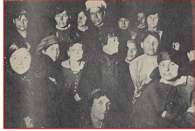
کولونتای در میان زنان کارگر روسیه (اوائل دهه ۲۰)

سبه و امتیاز مادی می باشد. توجه داشته باشید به اشکال ویژه ازدواج که اکنون اغلب یافت می-شوند. روابط به روال گذشته به امکانات زوجین از حیث "مال و مسکن" بسته نیست. سابقاً یک مرد مصمم به ازدواج می باید حساب کند، که دارای بودجه اداره همسر هست، آیا ازدواج به "کردنش می ارزد؟" و زنی که عقد زناشویی می-بست، حساب می کرد، که شوهر چگونه به نگاه-داری از او خواهد پرداخت. آن دو می کوشیدند