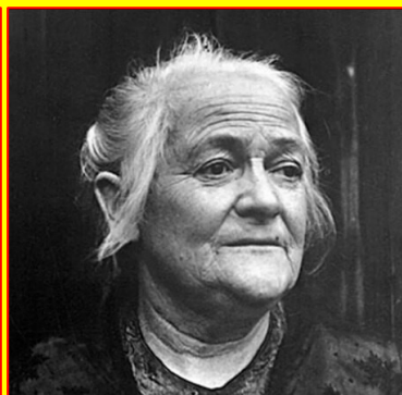
زتکین - کولونتای به اتفاق زتکین در کنفرانس سوسیالیستی بین المللی زنان