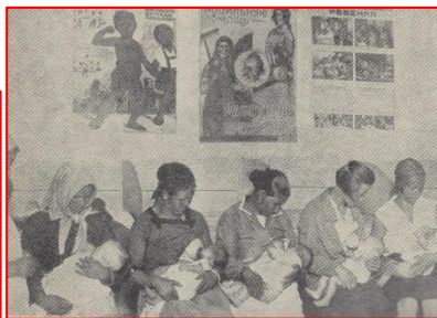
سمت راست: مادران کارگر مشغول شیردادن به کودکان در تنفسی بین ساعات کار روزانه. سمت چپ: پلاکات تهیه‌شده برای مواظبت از کودکان.

در مسئله حمایت از مادران روسیه شوروی برطبق وظیفه اصلی جمهوری کارگری عمل نموده است: تکامل دادن نیروهای مولده کشور، هم چنین بنا و تکامل نفس تولید. در رابطه با این وظیفه باید اولاً حداکثر ممکن نیروهای کار را از کار غیرمولد آزاد ساخت، و هدف مندانه جمیع نیروهای کار موجود را در بازسازی اقتصاد مورد استفاده قرار داد. دوماً باید برای افزایش پیوسته کارگران تازه نفس در جمهوری کارگری، رشد عادی جمعیت کوشید.