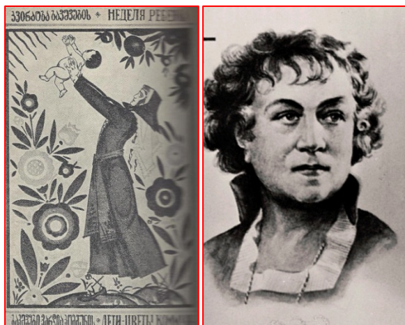
(راست) کولونتای، زن و کمونیست (چپ) پلاکات تهییج به مناسبت هفته کودک

آن جا که انتقاد، واکاوی هست، آن جا که اندیشگی فعال است، در حرکت است و راه می نماید، خلاقیت نیز هست، زندگی نیز هست، و این یعنی: حرکت به پیش، به سوی آینده.