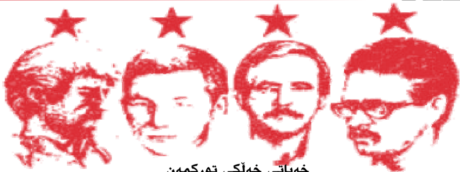
خه‌باتى خه‌لكى توركمه‌ن