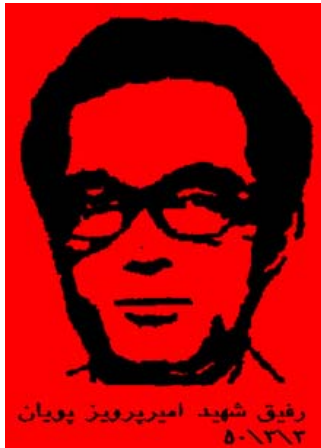
رفیق شهید امیررویز پویان ۵-۱۳۱۳

سپه‌می جوژه‌ردانی 1350 هه‌والی شهر و موقومه‌تی تا کو ئه‌سیری دوژمن چه‌کدارانه‌ی چریکه‌کانی فیدایی به‌خیرایی له بیټ . هاورئ ئه‌میر سهرانسهری شاری تاران بلاو بووه‌وه .