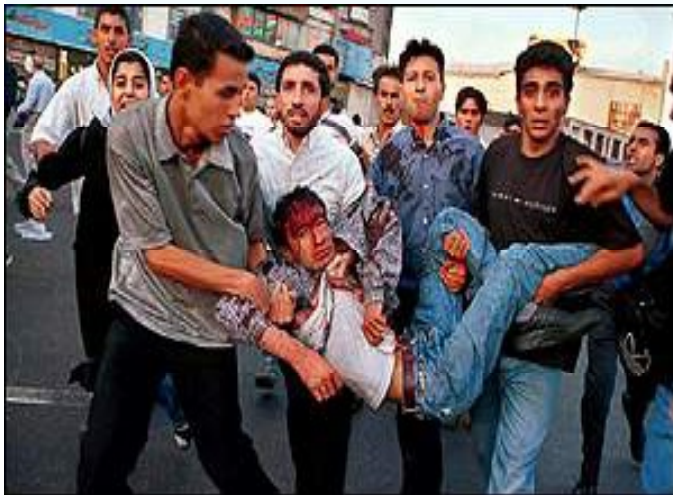
تماس با ما