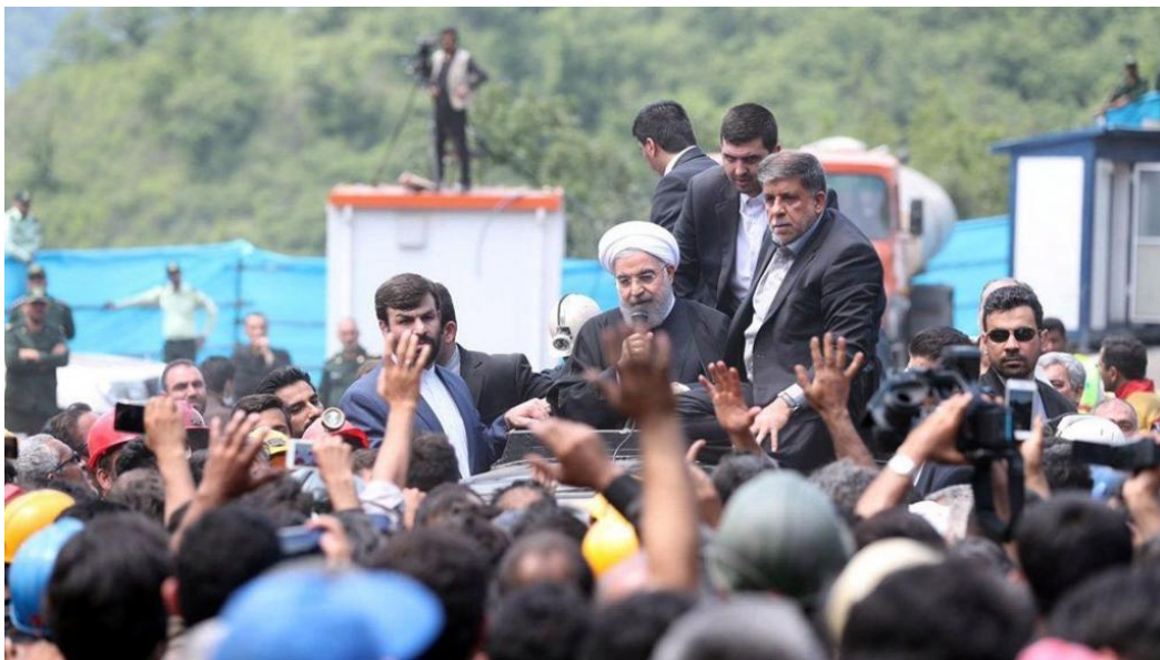
اعتراض معدنچیان معدن یورت گلستان به حسن روحانی رئیس‌جمهور

خبرگزاری صدا و سیما ایران، روز سه‌شنبه ۱۹ اردیبهشت ۱۳۹۶ - ۹ مه ۲۰۱۷، اعلام کرد که شمار جانباختگان انفجار در «معدن یورت» در آزاد شهر استان گلستان، به ۴۳ نفر رسیده است. در گزارش‌های قبلی، گفته شده بود در این انفجار ۳۵ معدن‌کار جان باخته‌اند. روز یکشنبه ۱۷ اردیبهشت - ۷ مه، حسن روحانی، رئیس‌جمهوری ایران به دیدار معدنچیان و خانواده‌های آنان رفت اما با انتقاد و خشم معدنچیان روبرو شد که ماشین او را زیر مشت و لگد گرفتند. خبرگزاری‌های ایران گفته‌اند که معدنچیان چندین ماه حقوق خود را از شرکت معدن، دریافت نکرده‌اند. ویدیوهای منتشر شده از سفر روحانی به آزادشهر نشان می‌دهد خانواده‌های قربانیان حادثه معدن یورت به خودروی حامل رئیس‌جمهور ایران حمله کرده او را مجبور به ترک محل کردند.